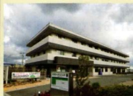
▲ サービス付き高齢者向け住宅・フラワーホーム